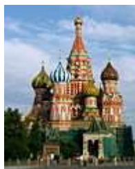
Ondřej Bartoň, 8. A